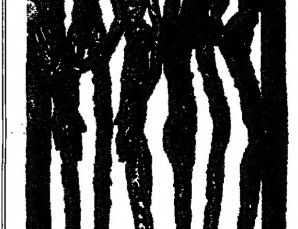
ثلاثة اصنام للثلاثه

لكن حلا، تجتاز صلابة اللذان، ترفو الرحم الصرغ، وتتمتع بايد لتسرق في الخيوية، جسدا ملطفا بتشار لليل، جسدا يلاطف اذراف نجمة، ويعلن بصوتها، ولا تحبها بلجام اللوان، ولا بالتحلب للزجة، لتكسد حولها لتسور منارها.